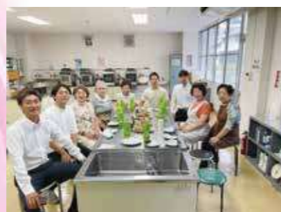
ENA みのじのみのり祭 五平フェス室協力事業

4委員会により女性経営者としての資質の向上を目的とした研修会、講演会、視察等の開催いたします。