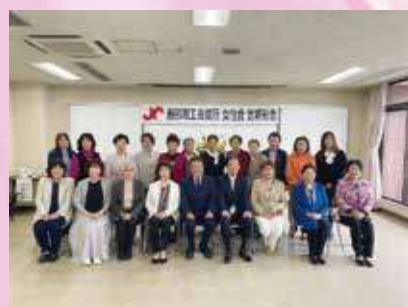
令和6年度定期総会

会員相互の親睦と連携を密にして、女性経営者の向上と商工業の振興を図り、地域社会の発展と商工会議所の事業活動に寄与します。