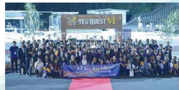
第37回 東海ブロック大会 恵那大会