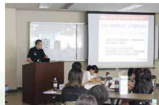
第16回 ジュニアエコノミーカレッジ in 恵那

私たちは、共に交流し、刺激し合いながら、まだ見ぬ自分の可能性を切り拓いていきましょう。迷わず行けよ、行けばわかるさ!