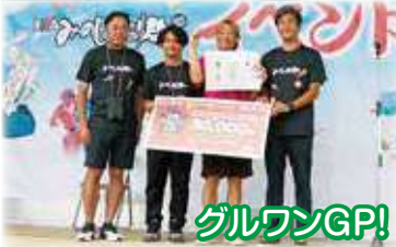
グルワンGP! 次米献納行列