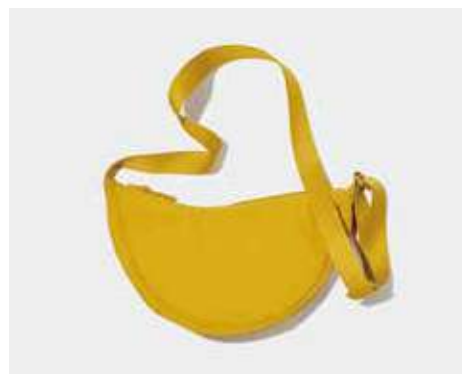
図：ユニクロホームページ 「ラウンドミニショルダーバッグ 概要より」 https://www.uniqlo.com/jp/ja/products/E461053-000/00?colorDisplayCode=44

今回の事例で学ぶべきは、自社が扱う商品・サービスは「日用品」「実用品」「嗜好品」のどの特性に分類されるのを見極める事、次に、その特性に合わせて購入者が知りたいであろう情報を如何にわかり易く紹介(見せ方)できるか?について学ぶ教材として紹介させていたのだ。読者の参考になれば幸いである。