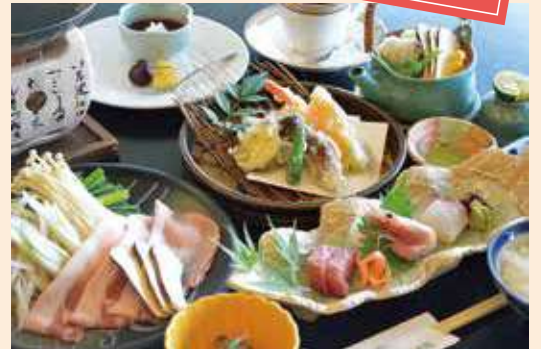
※写真はイメージです。一部変更となる場合がございます。