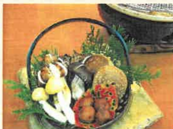
焼きマツタケ 11,000円(税込)