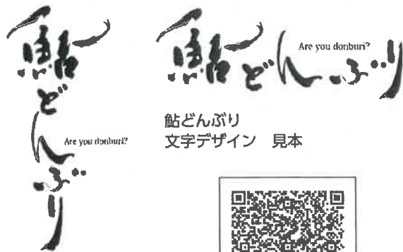
鮎どんぶり 文字デザイン 見本

食や宿泊事業者の売り上げ拡大に貢献す るため、経営支援メニューの一つとし て、6月より開始されたものである。ま た、コロナ融資の返済を控えた事業者に とっては、今まで以上の売上を確保する 必要性もあることから、是非、参加を検 討頂きたいと願っている。 このプロジェクトに参加するには、Q Rコードを読み取り岐阜県よろず支援拠 点のホームページから、申請書をダウン ロード頂き必要事項を記載の上、ホーム ページに掲載のメールへ申請書を提出頂 くことでダウンロード用のパスワードが 発行されるので是非、ご活用頂きたい。