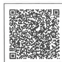
申し込み専用ページQRコード