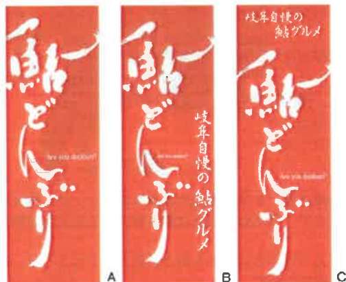
のぼりデザイン 見本

今回のコラムでは岐阜県よろず支援拠 点が始めた、〓清流の恵み〓鮎プロジェ クトの取組みを紹介させていただきた い。 〓清流の恵み〓鮎どんぶりプロジェク トとは、鮎と岐阜県産の食材2品以上を 組み合わせた飲食メニューを提供して いる事業者や新たに提供しようという事業 者向けに、広告宣伝に活用できる〓清流 の恵み〓鮎どんぶりロゴマークやポス ター、のぼり、ホームページ用のパナ ーデータを無料で配布するものである。 このプロジェクトは、コロナ禍で事業 を取り巻く環境が非常に厳しくなった飲