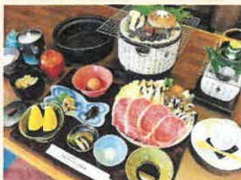
松茸まんぷく御膳 12,100円(税込)