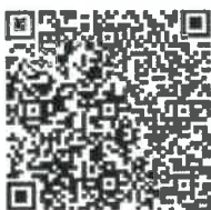
みどりの食料システム戦略専用ホームページ

沖縄の青果を食したいニーズを満たすために18年という歳月を要したのと同じように、CO2ゼロエミッションというトレンドに乗り遅れないためには、自社が置かれている市場の将来を想定し今から出来ることを一つ一つ積み上げていくことが最善で最良の経営戦略であると著者は信じる。