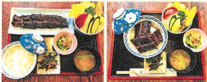
長焼き定食 3,000円(税込)

これからやってくる、暑い暑い夏に負けないように、多くの栄養素を含む“うなぎ”を食べ、暑い夏を乗り切りましょう!是非一度食べて来て下さい。