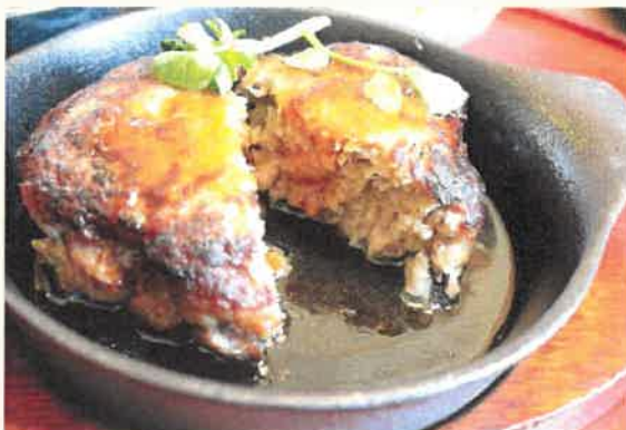
飛驒牛入りハンバーグ 1,190円(税込)

小さなお子様から高齢者の方々にも人気のハンバーグ、是非一度食べに来てください!!