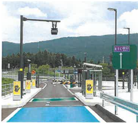
※スマートインターチェンジイメージ

づくり基盤整備計画」において、リニア開業までに恵那峡サイバースエリアにスマートインターチェンジの設置を計画しています。令和3年度は関係機関による勉強会の開催、NEXCO中日本や中部地方整備局との調整を行いました。スマートインターチェンジの実現に向け、引き続き関係機関との調整を図ります。なお、令和4年度には現地調査や概略設計などを行う予定です。 また、令和3年2月に要望いただきました。また、スマートインターチェンジと既存主要道路を結ぶアクセス道路の早期整備、スマートインターチェンジ周辺への企業用地の早期整備につきましては、スマートインターチェンジ設置計画の深度化に合わせ、検討を進めます。