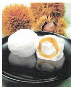
栗きんとん大福 1個 200円(税込)

このほかにも、イチゴやミカンなどを使った季節限定のお菓子もあり四季毎にお客様に楽しんで頂く工夫をしています。