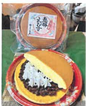
恵那あびす 1個 560円(税込)

今回紹介するのは大人気商品の「恵那あびす」と「栗きんとん大福」です。どちらも通年ある商品で、恵那あびすに関してはどら焼きの大きさとホイップクリームがたっぷり入っておりお土産にも人気の商品です。栗きんとん大福は、あんこにこだわり上品な生菓子の様な味が人気の一つです。