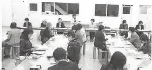
宇宙博物館の説明を受ける