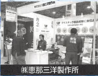
(株)恵那三洋製作所