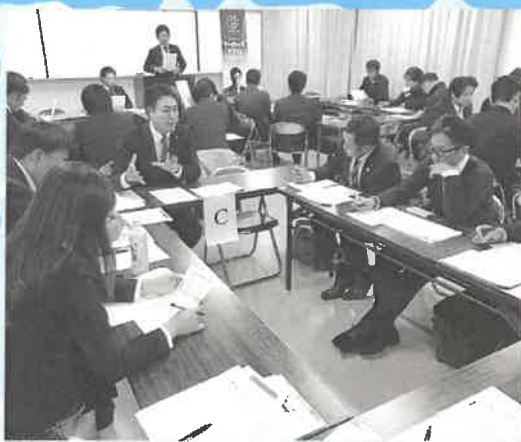
えなばく決起例会にて

11月21日、当所にて恵那グルメ万博（えなばく）決起例会を開催し、40名が参加しました。今年4月から実行委員会を立ち上げ、くっちゃえ！恵那の味、知っちゃえ！恵那の店、食べちゃえ！恵那名物をテーマに12月1日のまちなか市と2日のL1ラリーとの同時開催に向け準備を行ってきました。決起例会では、広報・イベント企画・出店店舗・会場設営の各室より進捗状況の説明がありました。その後、会場設営室のメンバーを中心に、青年部メンバーを4つの班に分け、当日のような動きをするのか入念に確認すると共に、えなばくを成功に導けるよう士気を高めました。