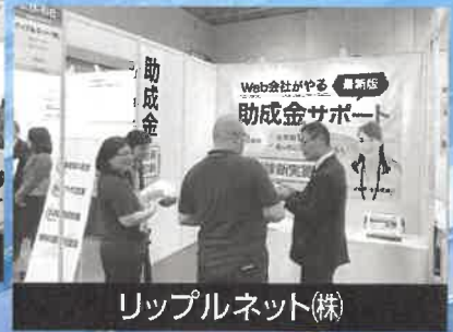
リップルネット(株)