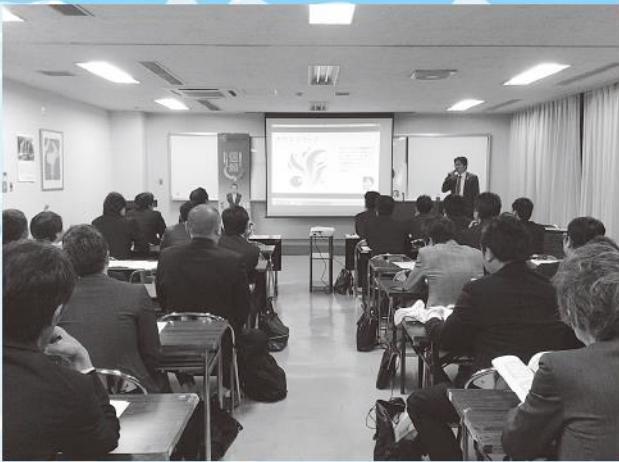
メンバーに向けた全国大会、概要説明

5月15日恵那商工会議所にて5月例会「全国大会・説明例会」として、平成30年2月に開催される、全国大会岐阜かかみがはら大会の概要や恵那YEGとしての役割について会員に説明しました。例年、ゲストとして全国大会に参加する立場から今年度はホストとして全国各地から集まるYEGメンバーをどのようにもてなすのか等を考え、参加総数6,000人規模の大会の大きさを再認識するとともに開催迄の10カ月を担当者のみならず会員一同、一致団結して取り組む為の士気を高める良い機会となりました。