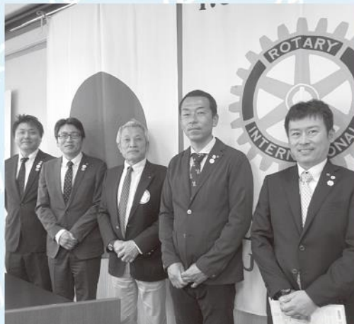
恵那ロータリークラブ