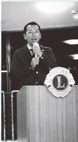
恵那ライオンズクラブ

5月9日倶楽部いち川にて開催された恵那ロータリークラブ、クラブ例会「卓話」(倶楽部いち川)、5月16日恵那ライオンズクラブ例会(岩寿荘)にお招きいただき、正副会長専務理事が出席し、平成29年度青年部の重点事業の説明を行いました。青年部が、企画している「みのりのみり祭」や「ジュニアエコノミーカーレッジ」等に加え、今年度は全国大会開催に関して、恵那市内で行われる分科会での取り組み等を説明し、青年部活動における地域貢献の取り組み等を外部にPRする良い機会となりました。