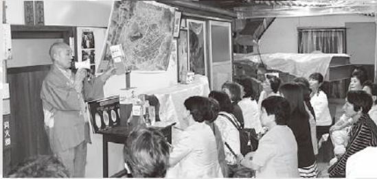
渡會社長から説明を つけるメンバー