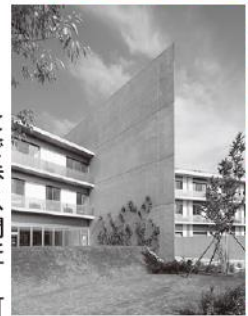
設計・監理 安藤忠雄建築研究所

事業紹介： 恵雄会グループで平成25年より恵那市岩村町にて運営させて頂いております、サービス付き高齢者向け住宅ハートウイングです。サービス付き高齢者向け住宅とは、バリアフリー対応の賃貸住宅で要介護認定の有無に関わらず、60歳以上の方であればどなたでもご入居していただけます。環境は緑に囲まれており、約1kmの散歩道もあり森林浴も出来ます。全館バリアフリーはもちろんの事、セキュリティシステムも完備しています。医療法人恵雄会との医療連携により医師をはじめ、24時間訪問看護が医療面をサポートします。同敷地内には特別養護老人ホーム ころの丘もございますので、様々な医療、介護ニーズにお応えできる体制を整えております。居住スペースは2階、3階となります。1階には、ウイングレストラン・カフェ・手打ち蕎麦がございます。美味しいスイーツや手打ち蕎麦を一度ご賞味下さい。レストラン、カフェのみのご利用も可能となっております。お気軽にお立ち寄り下さい。