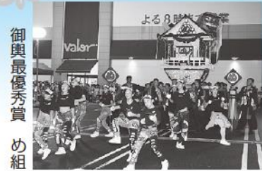
御輿最優秀賞 め組

ENAみのりのみのり祭を宣伝し、益々恵那を好きになってもらえるように会場を盛り上げました。また、本年4月発生した熊本地震へボーイスカウト恵那第一団と共に募金活動を行い、30,089円の義援金が集まりました。