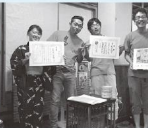
打ち上げ会場で受賞報告

25日には、青年部恒例のねぎ焼きに地元産のこんにゃくを加えた商品でまんぶく番付に出品し、見事関脇に入賞しました。