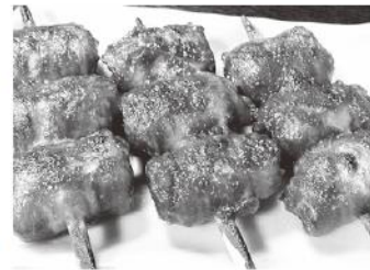
恵那まんぶく番付横綱 五平とん