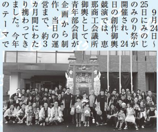
御神輿スタート前に記念撮影

9月24日(土)のみのり祭が開催され、24日の創作御輿競演では、恵那商工会議所御輿として、青年部会員が企画から制作、当日の運営まで、約3カ月間にわたって携わってききました。今年のテーマで「商売繁盛」に絡めてお稲荷さんをモチーフにした御輿を制作しました。