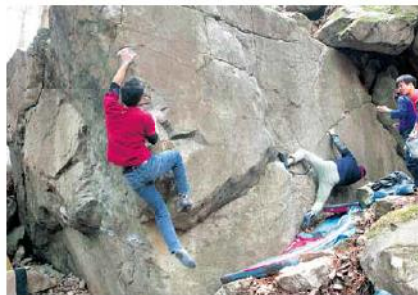
普段着で気軽にできる