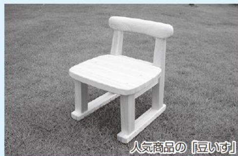
人気商品の「豆いす」

当工房は家具に愛着を持って長く使っていただく事をモットーに丈夫であるのはもちろん、シンプルで使いやすく飽きの来ない製品を手作りで制作しています。なかでも地元材の桧(ヒノキ)を使った子供椅子は、子供が最初に出会う「道具」として、物を大切に作る心も育てていただきたいと思います。木の温もりや、仕上げの優しさ、色合いを実際に触れていただく為に各地の展示会に出展してきました。そんな時に商工会議所の職員の方が巡回で当工房を訪れた際に小規模事業者持続化補助金制度の説明を受けました。この制度は展示会なども含めた販売促進にかかる経費の3分の2、50万円を限度に国が補助していただけるという制度でした。夏から秋にかけて名古屋や関西方面の展示会へ参加する予定があり、せっかくの機会だったので申請することにしました。ただ、いざ申請に必要な書類を記入しようとする、分からない事や不明な点が多く、できるかな?と不安でしたが、職員の丁寧なご指導により申請することができました。