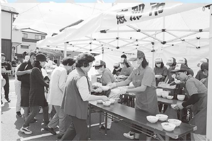
松茸ごはん販売（セントラルパーク会場）

9月24日・25日にみのじのみのり祭が恵那市中心市街地で開催され、25日に「松茸ごはん販売」を女性会メンバー18名が、市内金融機関及び市役所職員のボランティアの協力により担当いたしました。 晴天に恵まれ2カ所の販売会場は販売開始1時間前より行列ができ、約1時間30分ほどで予定の3,350食を完売することが出来ました。