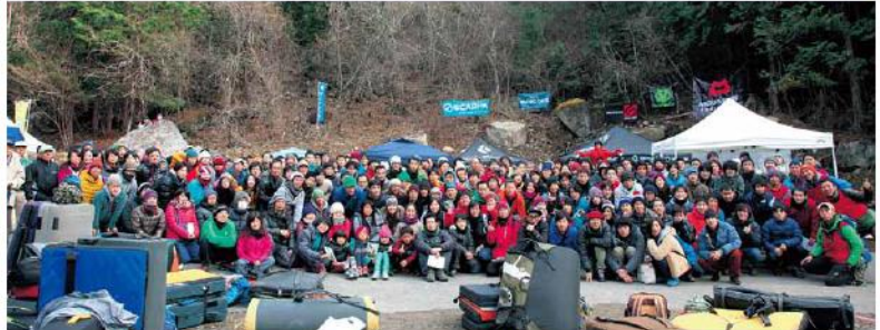
「里エリア」オープニングイベントには200名以上のクライマーが集まりました

恵那市にある笠置山(標高1,128m)にはボルダリング(フリークライミングの一種)に適した巨岩が多く、平成21年6月に笠置山クライミングエリアをオープンしました。8箇所のエリア内には300個以上の岩場が存在し、年間1万人が訪れる国内最大級のクライミングエリアです。