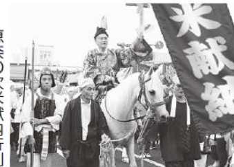
恵那の次米献納行列