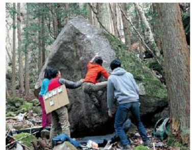
友人と一緒に楽しむ