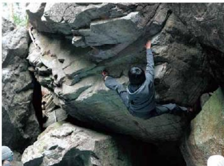
上級コースに挑む