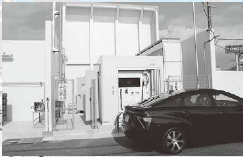
山本石油 水素ステーション恵那

研修会では、山本石油水素ステーション恵那にて、水素自動車の研修を行いました。現在の自動車は、ガソリンと電気が燃料の主流となっている中で、新しい