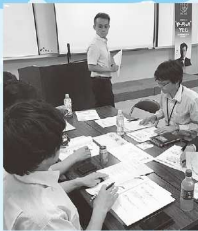
えなばくについて議論する青年部員

7月12日に当所にて、説明会を開催し、22名が出席しました。12月のまちなか市と同時開催予定の恵那グルメフェス(仮称)の名前が恵那グルメ万博「えなばく」に決まり、趣旨や概要の説明がされました。