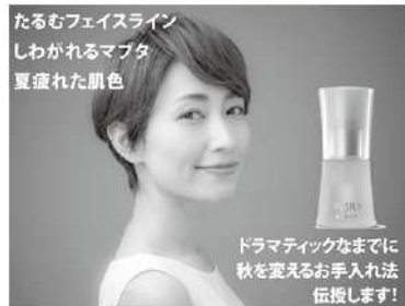
たるむフェイスライン しわがれるマブタ 夏復れた肌色

「ファンデーションを取ったら、シミだらけ」それは30年前の私でした。もともと化粧品店でお化粧のテクニクが上手になればなるほど、自分の顔のシミが濃くなっていく現実がありました。一度使ったら、女性が止められなくなる化粧品は怖いのです。そこで一念発起し、スキンケアでオリジナルの「素肌美エステ」を開発しました。どなたでも自然な素肌美を取り戻すエステです。素肌美人になれますよ。私は72才になる今も、ファンデーション無しのすっぴん肌。素肌美生活を楽しんでいます。年齢を重ねた今こそ、ファンデーションを卒業して自然な素肌に戻りませんか。清潔感が違いますよ。きれいなおばあちゃんと一緒にしましょう(笑)