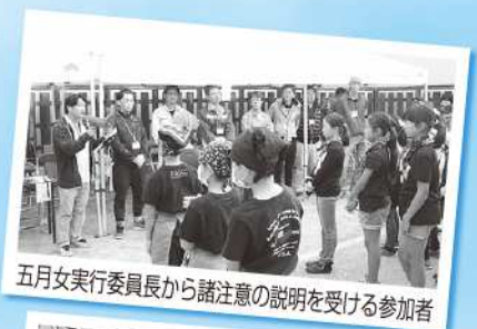
五月女実行委員長から諸注意の説明を受ける参加者