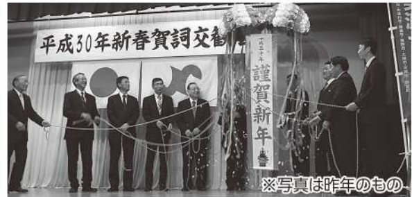
※写真は昨年のももの

平成31年の新春を迎えるにあたり会員の皆様の益々の繁栄を期し、相互の親睦を一層深めるため賀詞交歓会を開催いたします。是非、ご出席下さいませ。