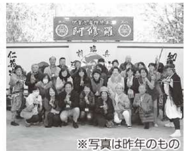
※写真は昨年のももの

会員親睦事業の一環として、会員同士の交流・連携、情報交換の機会として、「グルメツアー」を開催致します。是非ご参加下さい。