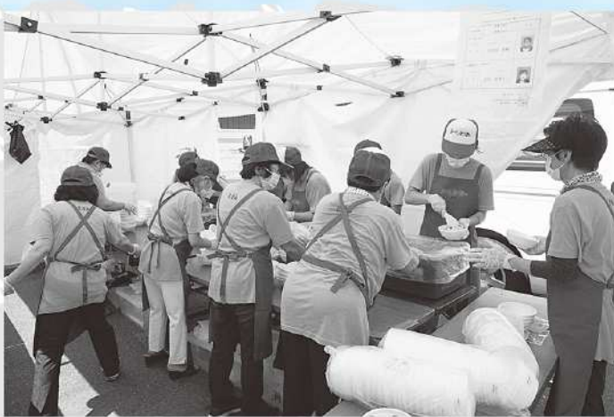
松茸ごはん販売にて

9月22日・23日にみのじのみのり祭が恵那市中心市街地で開催され、23日に「松茸ごはん販売」を女性会メンバー16名が、市内金融機関及び市役所職員のボランティアの協力により担当しました。晴天に恵まれ2カ所の販売会場は販売開始前より行列ができ、約1時間で予定の約3,000食を完売することが出来ました。