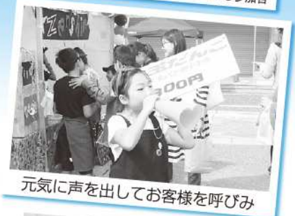
元気に声を出してお客様を呼び込み