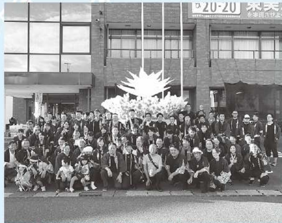
みこし出立式にて

た。2日間を通し、多くのメンバーが参加し交流できたことで青年部の絆がより一層深まりました。