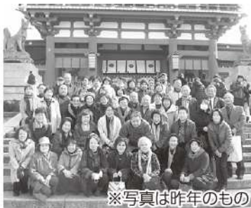
※写真は昨年のももの

会員親睦事業の一環として、会員同士の交流・連携、情報交換の機会として、「商売繁盛・伏見稲荷大社ツアー」を開催致します。是非ご参加下さい。