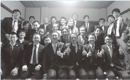
桔梗塾、美濃加茂YEGとの合同写真

その後、お食事処金よしへ移動し懇親会を開催し、恵那YEG、桔梗塾、美濃加茂YEGそれぞれが名刺を交換し交流を深めました。