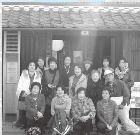
中山道大湫宿旧森川訓行家住宅資料館前にて