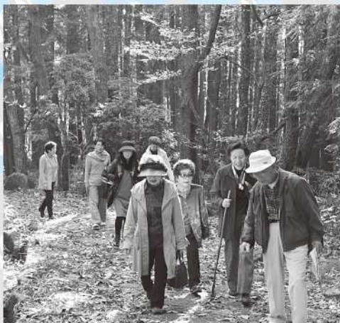
石畳の琵琶峠を実際に歩く女性会メンバー