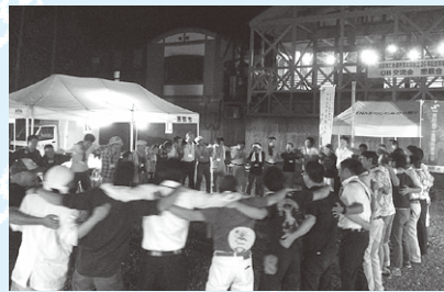
懇親会の締めでのサライ熱唱

念事業を実施しました。本事業は形式的な式典等は行わず、青年部の礎を築いていただいたOBの諸先輩方をメインに招き、総務広報室企画の思い出YIEGプロジェクトに加え、広報誌やろまいかのレプリカを出席されたOBへ配布する等、現役時代の懐かしい資料や写真により、当時を振り返っていただきました。その後野外駐車場で懇親会では、OBの皆様から多数の激励をいただき、今後の事業に反映させるべく有意義な情報交換の場となりました。