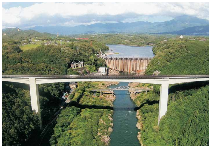
東雲大橋と東雲橋