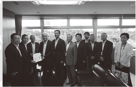
要望書を手渡す参加者

模災害対策の輸送路など、瑞浪、恵那市には必要な道路であるため早期整備と予算確保について強く要望いたしました。