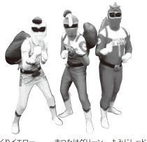
くろイエロー まつたけグリーン もみじレッド

みのじのみのり祭を宣伝するために結成されたPR部隊! 祭りの楽しさを伝えるとともに子供や大人もますます恵那が好きになるように祭りに盛り上げます。今年はゴミ捨て禁止を呼びかけながらクリーンアップに協力してくれた方へプレゼントがあるかも?