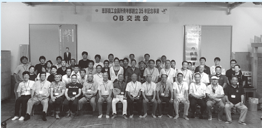
OBの皆様と記念撮影