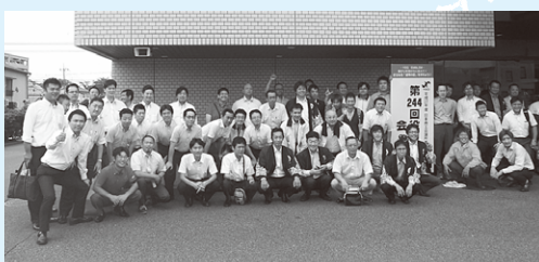
役員会終了後の記念撮影

7月18日に岡山プラザホテル(岡山県)にて日本商工会議所青年部第244回役員会が開催され、平成29年度(平成30年2月開催予定)の第37回全国大会の開催について岐阜県が承認を受けました。