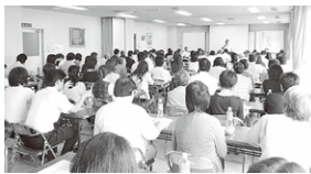
会場いっぱい受講者

7月9日に「マイナンバー制度準備対応」のテーマで中津川法人会との共催にてセミナーを開催し99名の方に参加していただき実施しました。2013年5月に「行政手続きにおける特定の個人を識別するための番号の利用などに関する法律」が成立し、2016年1月から、企業に共通番号の利用が義務付けられる事を受け、本セミナーを開催いたしました。セミナーの中では共通番号制度の概要の説明の後、日頃の業務の中で起こるさまざまな影響、講師である富士ゼロックス社内での取り組み等の概略を含めて対応の事例などを解説いただき大変参考になるセミナーでした。