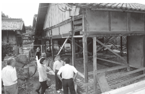
飯地空き家リフォーム塾の説明を受ける振興委員

8月25日、小規模企業振興委員14名が、新東雲橋道の駅構想予定地と飯地空き家リフォーム塾2箇所を視察しました。この事業は、地域の課題を現地に向いて実際に見聞きすることにより具体