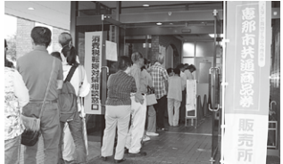
一般販売初日の様子

7月1日より国の地域活性化・地域住民生活等緊急支援助交付金の交付を受け、恵那商工会議所・恵那市恵那商工会等市内19カ所において販売し、同月9日に完売しました。