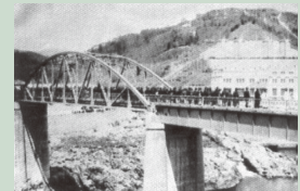
二代目 昭和6年完成