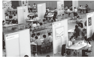
就職面接会会場の様子

参加企業は自社の特色をPRして、よりよい人材を確保するための面接を行い、また、求職者も数社のブースを訪れ、自己の適性にあった職業を求め熱心に企業の面接を受けていました。