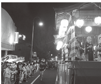
恵那丸を中心に盆踊りの和が広がった

恵那まちなか市では、フリーマーケット、軽トラ市場などの開催と、「まちのみ市」と題し飲食店の協力を得て限定メニューを用意いただき、多くのお客様に楽しんで頂きました。