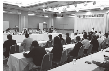
情報交換会の様子

校進路指導担当教諭並びに県内大学キャリア支援担当者が、「新規学卒者に対する求人計画」や「新規学卒就職予定者の動向」等について情報交換を行い、新規学卒予定者の地元就職を促してもらうよう働き掛けました。