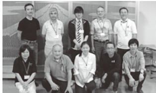
出展された皆さん

今回で6回目となる木工展が6月14日、15日に恵那文化センターにおいて開催されました。当部会員10事業所の出品したデザイン家具、建具、塗り器などの展示を行い恵那が育む木の文化を紹介しました。2日間で314名の方にご来場いただき、盛大に開催する事ができました。