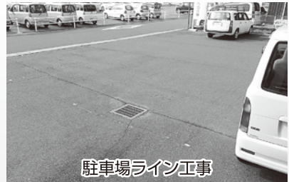
駐車場ライン工事