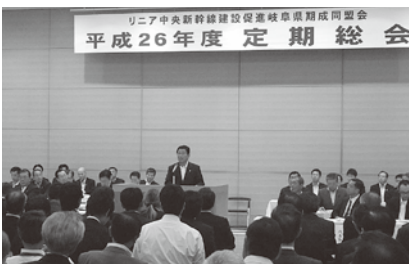
挨拶する古田知事

九州新幹線の全線開通する中で、熊本県としてどのよう街づくりをしたのか、そしてご当地キャラクターとして全国に認知されるようになった「くまもん」の発祥秘話についてなど大変興味ある講演会となりました。